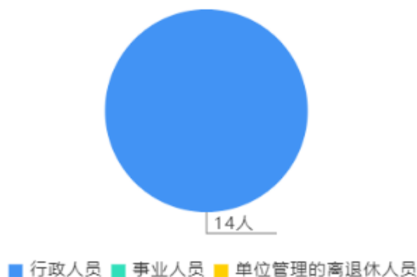
人员情况构成饼图

截止上年底，本单位人员编制19人，其中行政编制19人，事业编制0人；实有人员14人，其中行政14人，事业0人。单位管理的离退休人员0人。