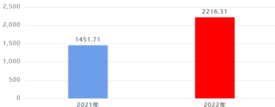
财政拨款收入、支出总计对比图 (单位: 万元)

项目（第一阶段）、农村环境整治、2022年“三类”小城镇建设市级资金、中央农业生产救灾资金、户厕提升改造、中央、省市级衔接资金、通村通组公路补助、抢险救灾等项目资金支出。