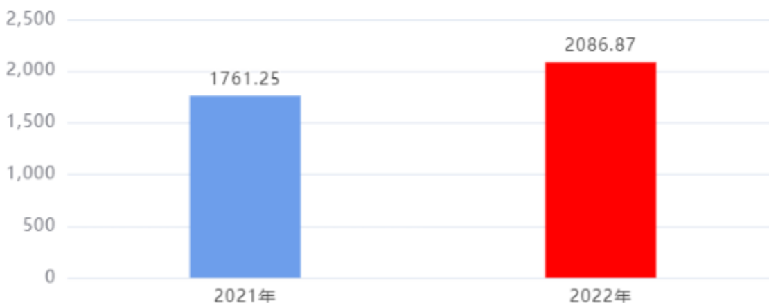
收入、支出决算总计对比图（单位：万元）

2022年度收入总计、支出总计均为2,086.87万元，与上年相比收入总计、支出总计均增加325.62万元，增长18.49%，增长的主要原因是：本年项目增加，项目支出增加。