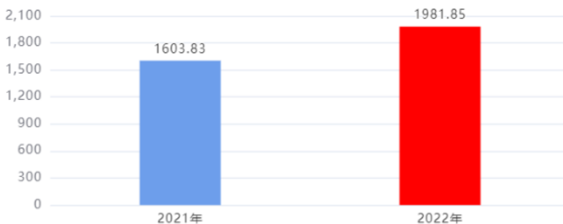
财政拨款支出对比图（单位：万元）

2022年度一般公共预算财政拨款支出年初预算906.06万元，支出决算1,981.85万元，完成年初预算的218.73%，占本年支出合计的94.97%。与上年相比，财政拨款支出增加378.02万元，增长23.57%，增长的主要原因是：项目支出增加。