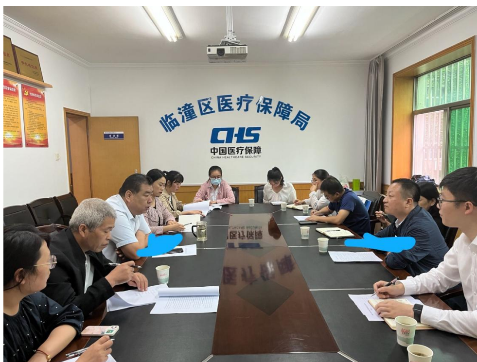
图 2-1 在区医保局召开绩效评价进驻会